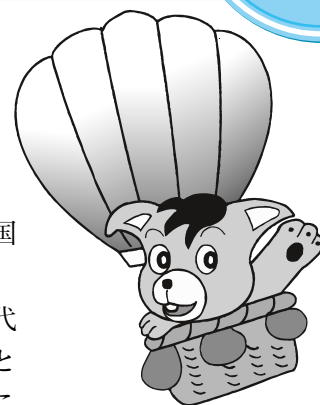
国民年金マスコット ハッピーちゃん

※保険料を納めるのが困難な方には免除制度があります。16年度の免除申請がお済みでない方は、お早めに申請されて下さい。