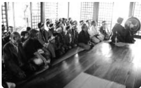
子ども綱当日八幡神社でお祓いを受ける子どもたち