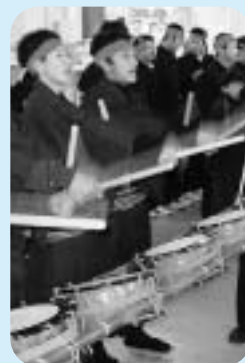
長崎県上五島 有川町の鯨唄

お問い合わせ先 呼子町文化連盟事務局 82-3011 (窓口：教育委員会教育課)