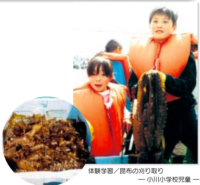
体験学習／昆布の刈り取り