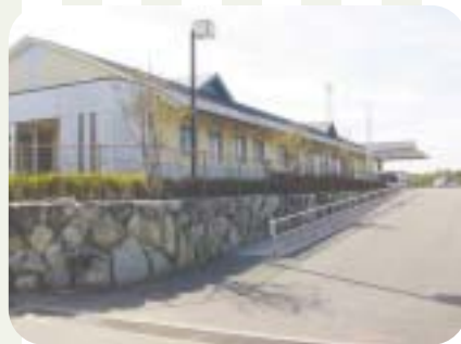
老人ホーム延寿荘(殿ノ浦岡)