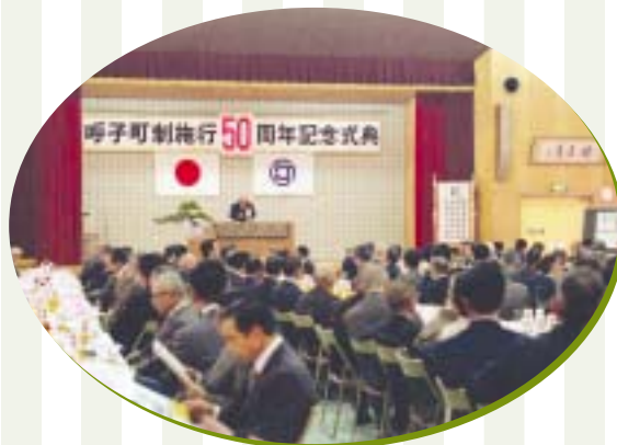
町制50周年記念式典