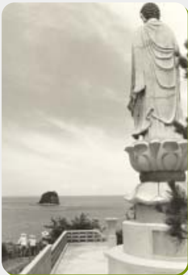
海難供養の阿彌陀如来像(尾ノ上公園)