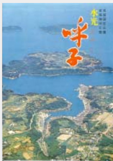
水光呼子の観光ポスター(昭和40年代)