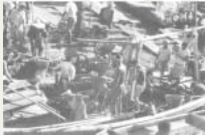
昭和20年代の鰯網漁の全盛(小川島)