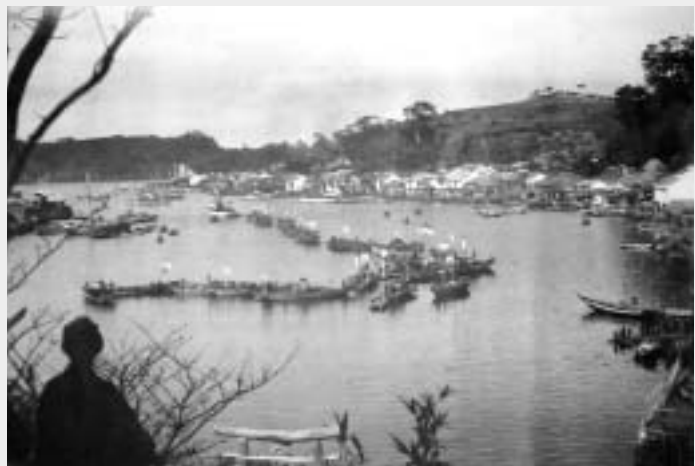
くじら船の出漁(仕廻式)