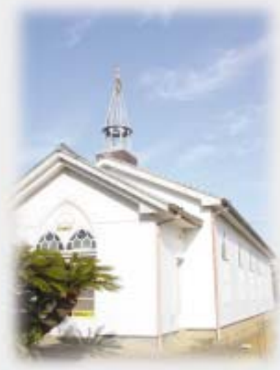
カトリック呼子教会(殿ノ浦西)