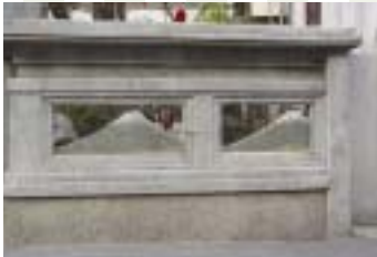
殿ノ浦の旅館(殿ノ浦浜)