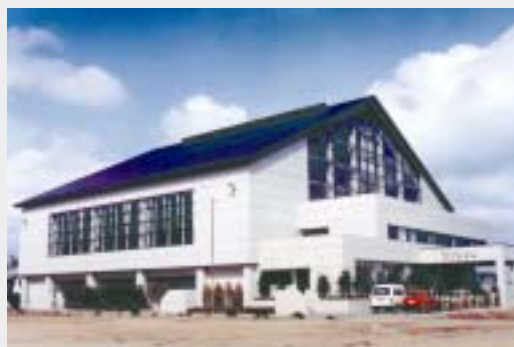
呼子町スポーツセンター(愛宕町)