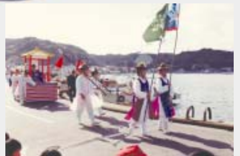
李朝通信使再現パレード