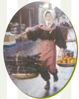
ふれ売り(昭和20年代)