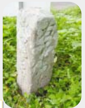
唐津への道標(天満町)