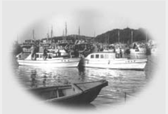
呼子港にひしめく避難の船(昭和20年代)