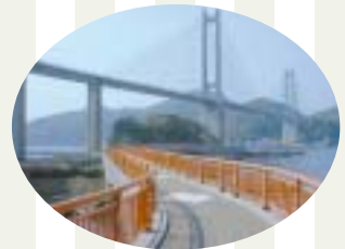
呼子大橋と弁天遊歩道(殿ノ浦浜)