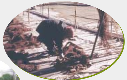
魚棚に干された網(昭和30年代)