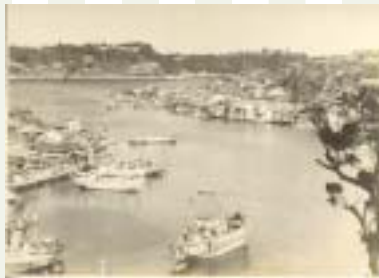
昭和20年代の呼子港(愛宕町)