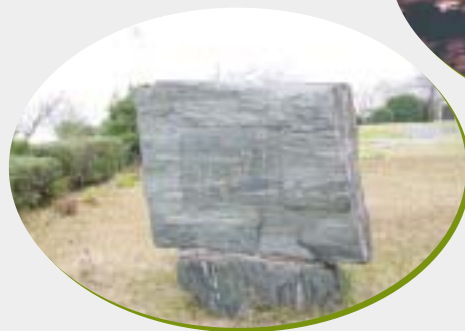
吉井勇の歌碑(尾ノ上公園)