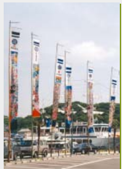
節句の武者幟(愛宕町)