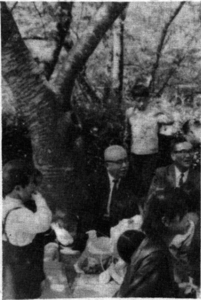
たのしい一日おとうさん

呼子町母子連盟(会長山下光子さん)主催の「一日お父さん」が今年も晴天に恵まれた四月二十九日(天皇誕生日)に行なわれました。当日は、町長、議長、警察署長、小中学校長、福祉事務所長さんのお父さんとお父さんのお子五十二人他総勢八十五人で二台の貸切バスにのって、午前八時呼子を出発武雄市御船山レジャーセンター内で満開のつつじを眺め乍ら、お父さん達と話をしたりおいしい弁当に舌鼓をうち面白い奇術や手品に感心し、大浴場で泳いだりして午後四時三十分、みんな無事に呼子へ帰りました。